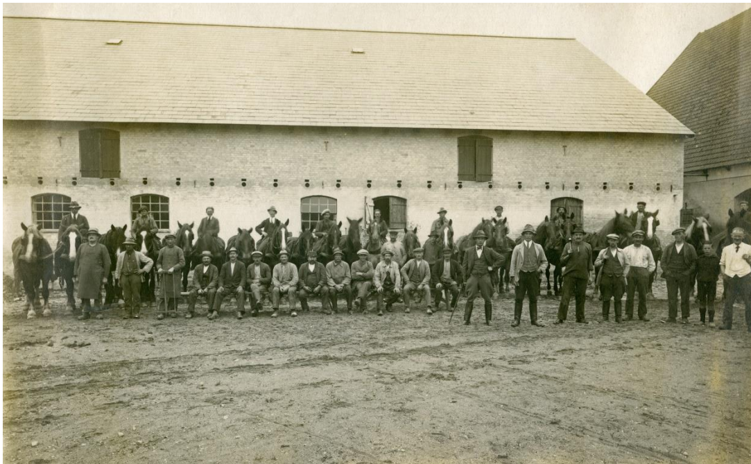
Folkeholdet på Kjærsgård ca. 1920