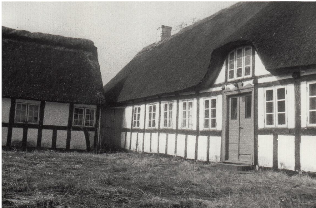
Bro Humlegård 1979