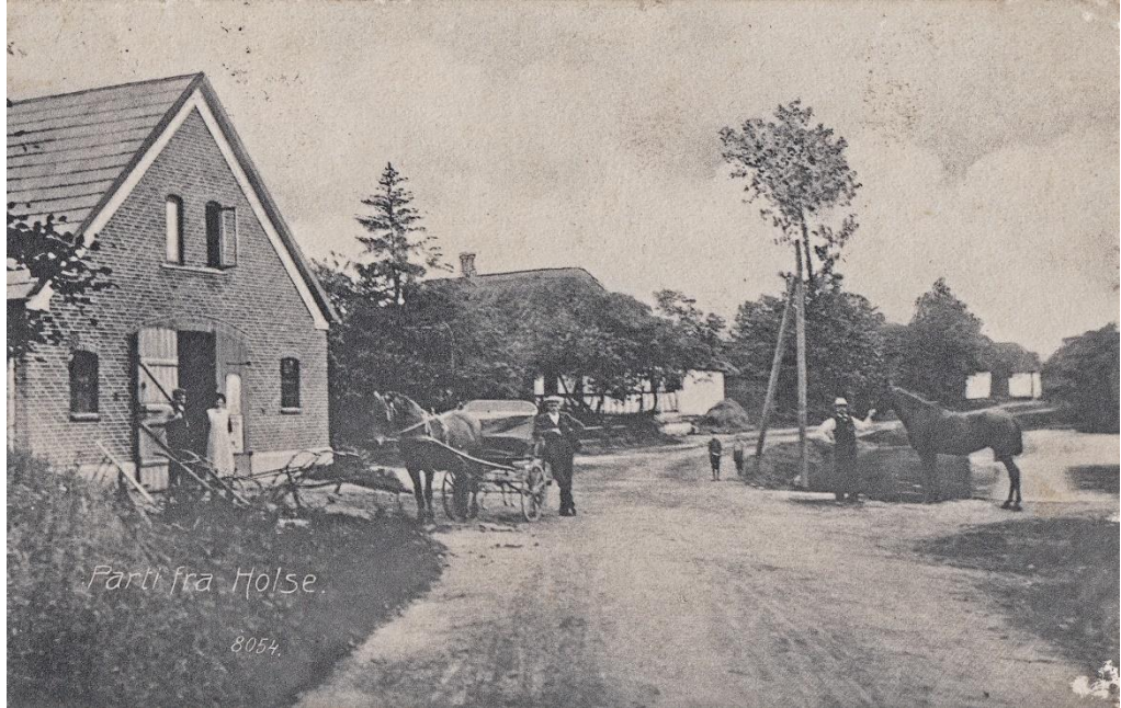
Farti fra Hølse.