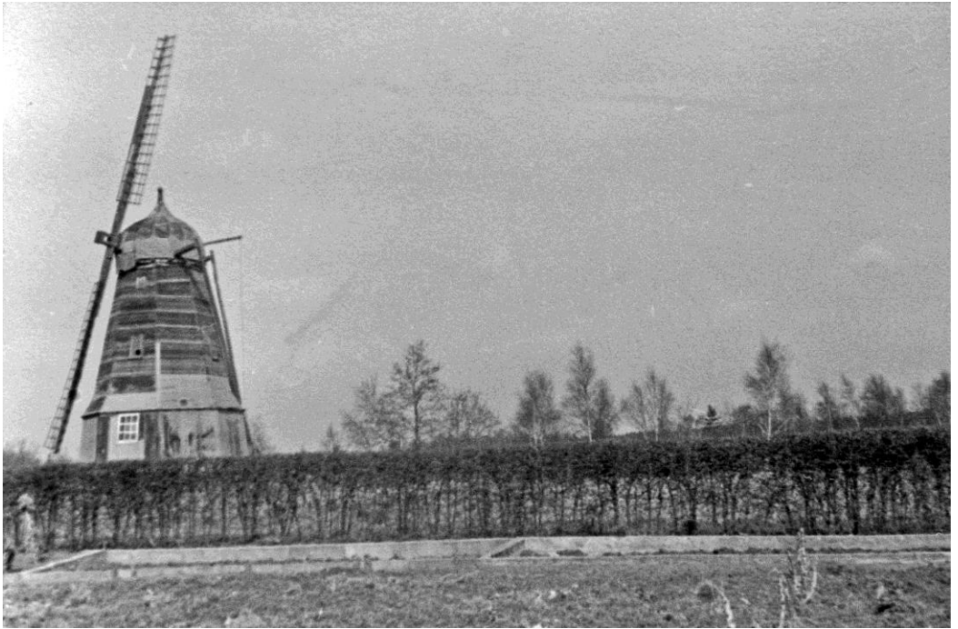
Møllen i Holsø, nedrevet i 1980.

Præsten har vistnok villet hævne sig. Det har han gjort på den måde, at i over 8 år er der ikke sket en eneste tilførsel, hverken i Brenderup eller i Ore kirkebog. 1761 døde han.