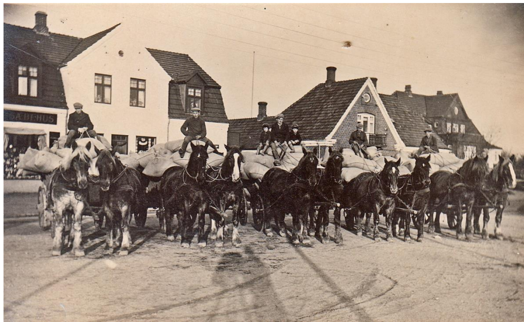
Bubbelgård kører frø til Brenderup Station 1925.