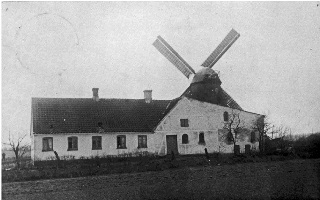
Køstrup Mølle ca. 1912